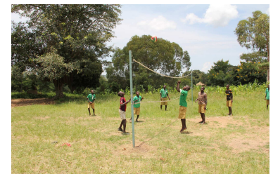
Auch Sport und Spiel sind wichtig, damit die Kinder gerne zur Schule kommen

CO-OPERAID engagiert sich in Ostafrika und Südostasien für das internationale Kinderrecht auf Bildung. Der Verein wurde 1981 gegründet, ist politisch und konfessionell unabhängig und seit 1998 ZEWO-zertifiziert.