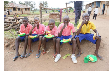
Schüler beim kostenlosen Mittagessen an der Schule

Die Schulen sind Staatsschulen und werden auch nach Projektschluss weiter betrieben. Das Projekt ermöglicht ihnen eine verbesserte Infrastruktur und einen Lehr- und Lernprozess, der eine höhere Bildungsqualität bewirkt. Gesamthaft bewirken die Leistungen eine Entwicklung zur kinderfreundlichen Schule, von welcher mehrere Generationen von Schüler/innen werden profitieren können. In den Schulgemeinden wird nachhaltig die Alphabetisierung verbessert, was einen Multiplikations-Effekt der Wissensweitergabe ermöglicht. Die Einkommensprojekte der ärmsten Familien und die Spargruppen haben sich in der ersten Projektphase als dauerhaft erwiesen.