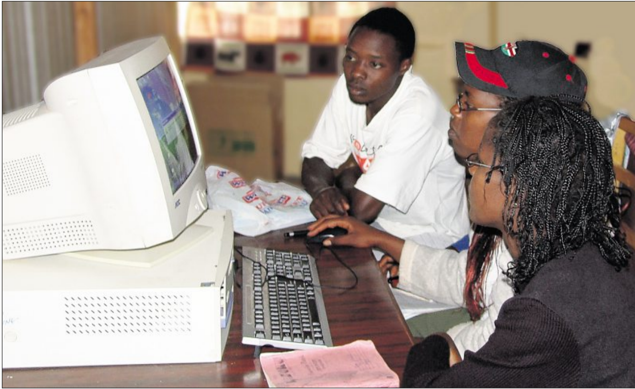
Zollikon trägt mit der Förderung eines Berufsbildungs-Projektes in Kenia dazu bei, dass junge Menschen eine Berufsausbildung absolvieren können.

Hilfe für Afrika Engagement der Gemeinde für die Berufsbildung in Kenia