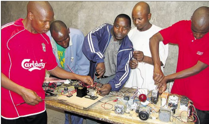
Die Auszubildenden erlangen Wissen, das auf dem Arbeitsmarkt gefragt ist.

Wer helfen möchte: Co-Operaid, Kornhausstrasse 49, Postfach, 8042 Zürich, Postkonto 80-444-2; Tel. 044 363 57 87; www.co-operaid.ch.